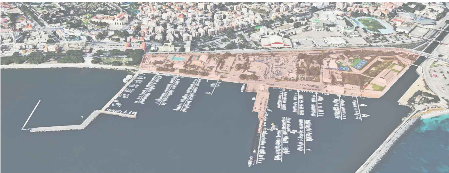
Piano Attuativo Zona A del P.R.P. del Porto di Cagliari

Autorità di Sistema Portuale del Mare di Sardegna